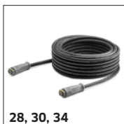
28, 30, 34